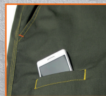
Bolsillo para móvil