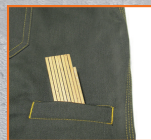
Bolsillo porta metro